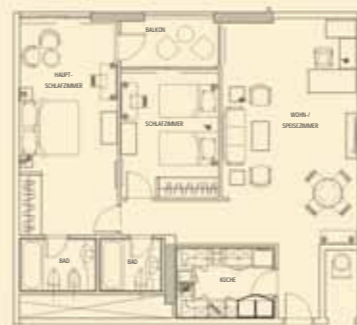
IMPERIAL SUITE (114 qm)