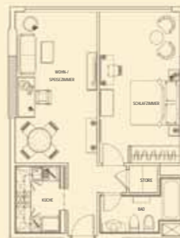
GRAND EXECUTIVE SUITE (69 qm)