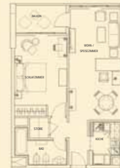
EXECUTIVE SUITE (68 qm)