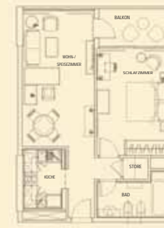
DELUXE SUITE (65 qm)