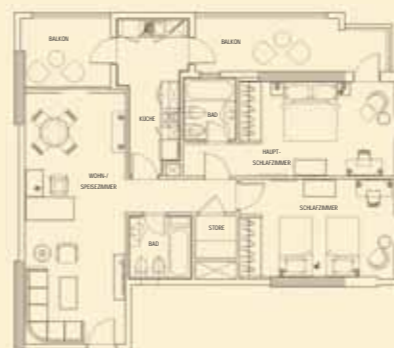
GRAND IMPERIAL SUITE (121 qm)